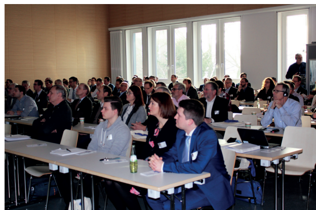
3. Mönchengladbacher Flechtkolloquium