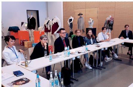
Impressionen: Ausstellung (links) & Workshop „CSR“ (rechts)