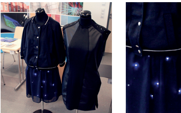
Ausstellungsstücke aus dem Bereich der „Smart Textiles“

Fünf Tage lang diskutierten 189 Forschende, Unternehmerinnen und Unternehmer aus 16 verschiedenen Ländern sowie 60 internationale Studierende über die neuesten Entwicklungen, Maschinen sowie Anwendungsmöglichkeiten von Schmaltextilien und smarten Textilien.