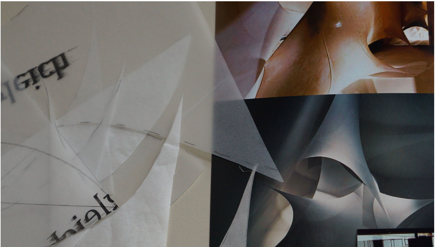
Design: In zero: deformed Sculptile Texture by Kerstin Jany